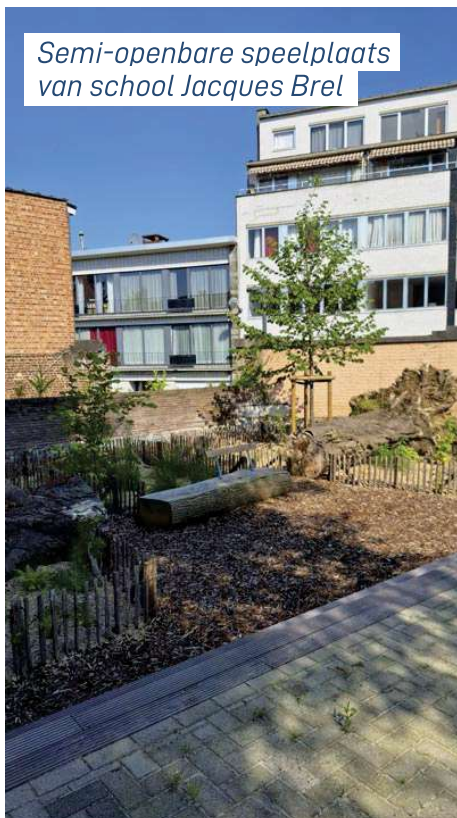
Semi-openbare speelplaats van school Jacques Brel