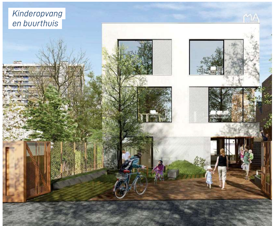
Kinderopvang en buurthuis