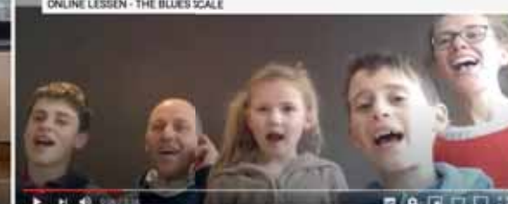
JA ONLINE #1 - This Little Light Of Mine (zangklas jazz-pop-rock)

maken,... En daarnaast bleven veel leerlingen wekelijks trouw op post voor hun les op afstand, iets om telkens naar uit te kijken.