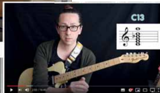
ONLINE LESSEN - THE BLUES SCALE