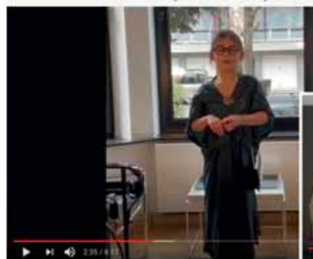
Het woordatelier van de Jetse Academie in quarantaine