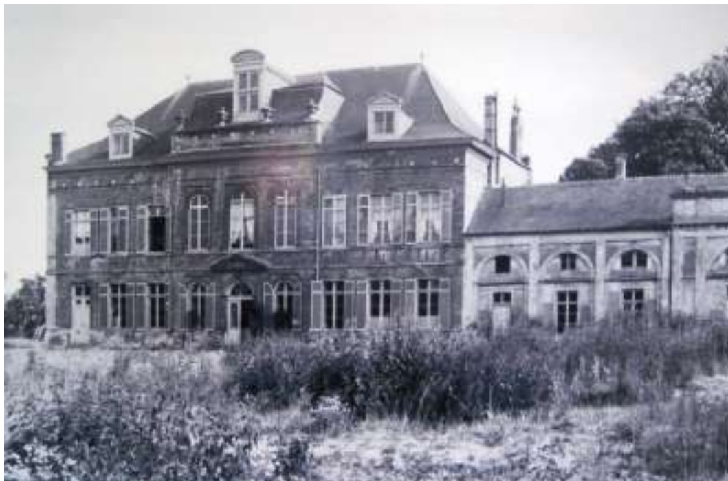
L'Abbaye de Dieleghem en 1929

Voici le deuxième épisode de l'histoire de l'Abbaye de Dieleghem abordée dans le numéro précédent du Jette Info.