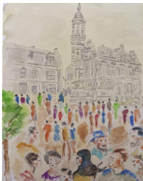
3 e prix : Ghalamkaripour Bijan "Jette anno 1930"