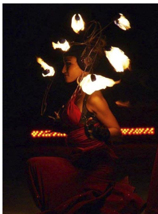
Anima © Géraldine Tranchecoste