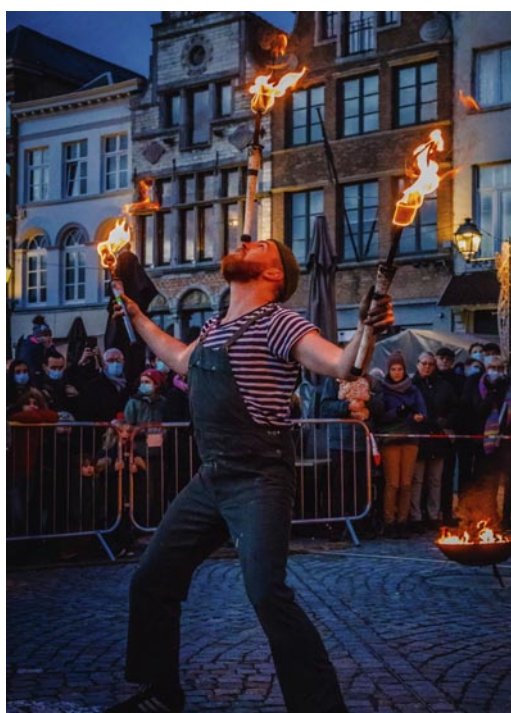
Lucifer's Party

Quel est le rendez-vous le plus chaud de l'année ? Sans aucun doute Voenk d'hiver ! Dès la tombée de la nuit, vous pourrez profiter, sur la place Cardinal Mercier, de spectacles de feu, d'acrobaties et d'animations. Ou comment bien démarrer la période de fin d'année avec une soirée qui ravira petits et grands.