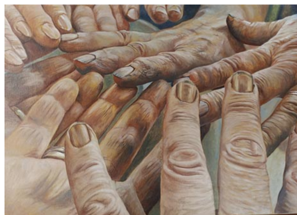
2 e prix : Luc Dechamps "Les mains sales"