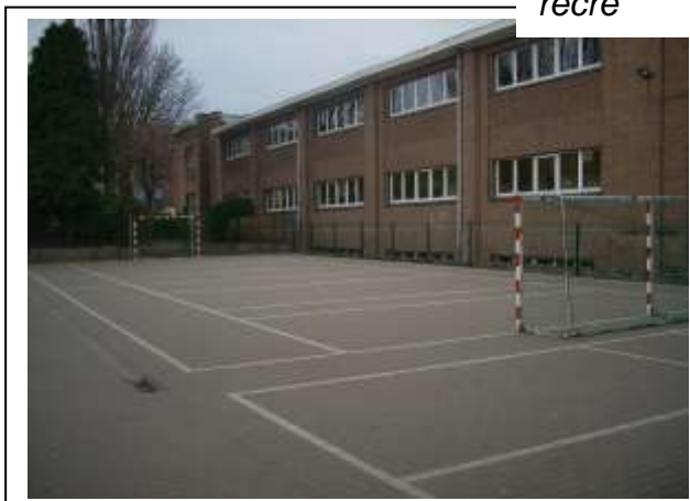
Les 2 cours de récré

Le réfectoire est commun aux enfants de primaire et maternelle. Grands et petits y mangent ensemble.