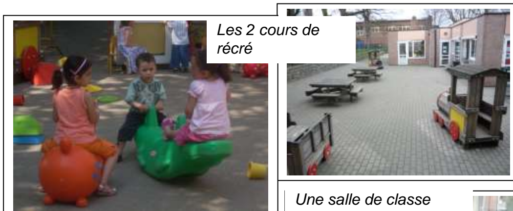
Les 2 cours de récré

Les élèves bénéficient de 2 petites cours de récréation dont une propose une plaine de jeux, de sanitaires adaptés, d'un local de gymnastique adapté à leurs besoins et d'un espace dans la bibliothèque leur proposant des livres adaptés à leur âge.