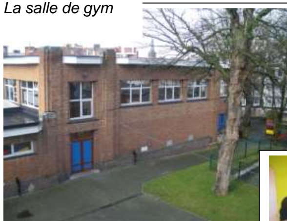
La salle de gym