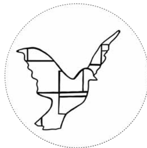
Illustratie: Nina Neuray

Zaterdag 9 november van 11.15u tot 18u Esseghemstraat 135 - Gratis