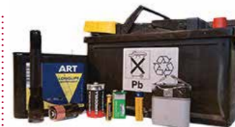
BATTERIJEN EN ANDERE