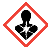
Toxisch bij inademen

Deze nieuwe pictogrammen op witte achtergrond en met rode kader vervangen de symbolen op oranje achtergrond (van de oude wetgeving):