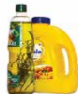
FRIITUROLIE EN -VET