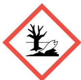
Gevaarlijk voor het leefmilieu