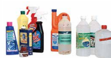
ONDERHOUDS- EN SCHOONMAAKPRODUCTEN