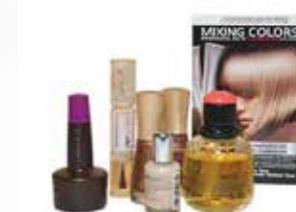
KLEURMIDDELEN, NAGELLAK & PARFUMS